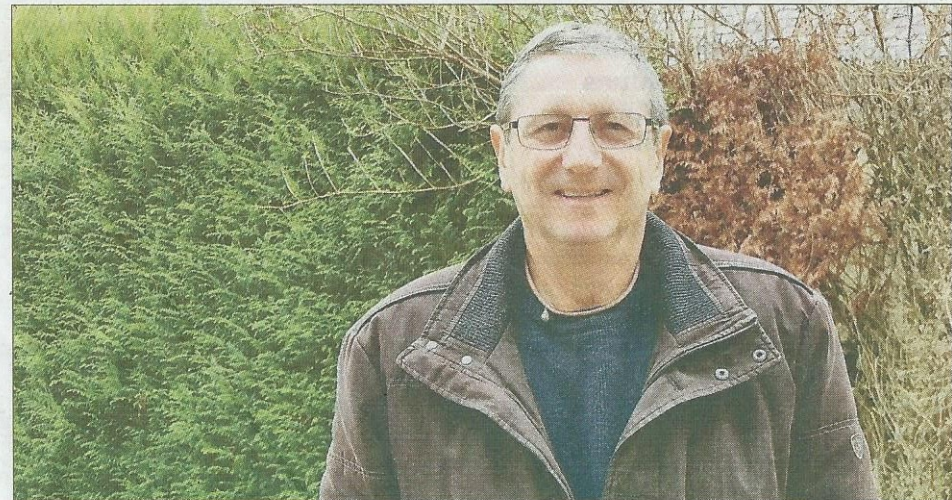
Le jeune retraité espère pouvoir proposer des manifestations à ses adhérents.